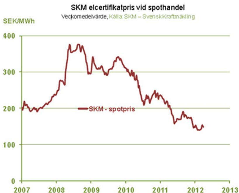
Figur 1. Spotpriser på elcertifikat 2007-2012 [5].

Systemet är ju marknadsbaserat så ingen vet idag vad systemet kommer att kosta fram till 2035. Figur 1 visar utvecklingen för spotpriser på elcertifikat de senaste fem åren.